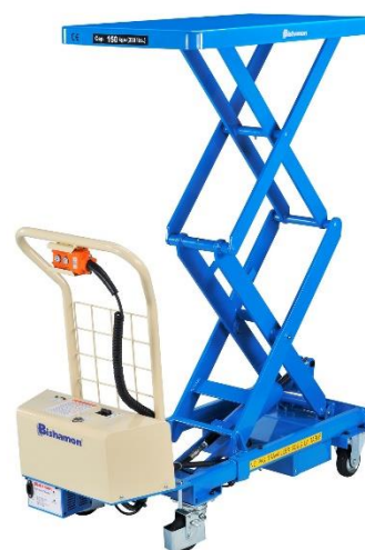
Tables élévatrices électrique Bishamon® Doubles ciseaux, de 150 à 500 kg