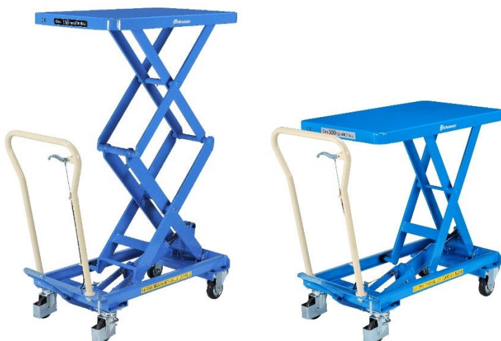
Tables élévatrices manuelles Bishamon® Simple ou doubles ciseaux, de 150 à 800 kg