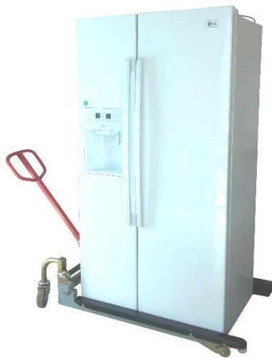
Déplacement d'un réfrigérateur