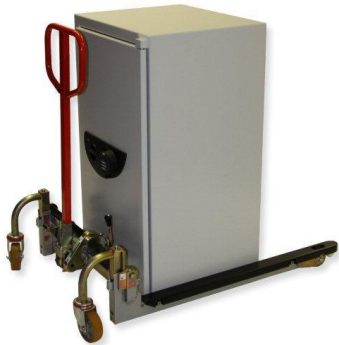
Déplacement d'un coffre fort