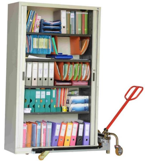
Déplacement d'une armoire pleine