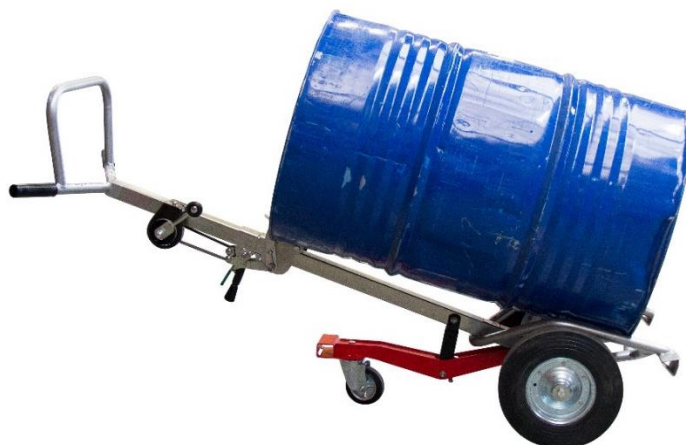
845 008 012 – Simple griffe