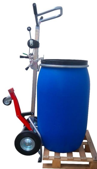
845 008 014 – Double griffe