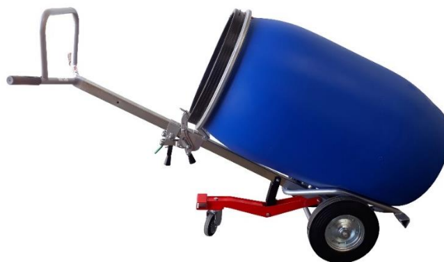
845 008 013 – Double griffe