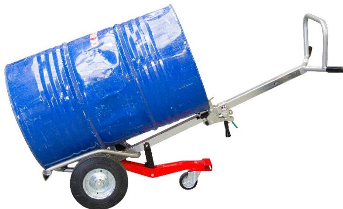
845 008 011 – Simple griffe

Ces diabes permettent de manipuler des fûts sans effort. Les modèles avec treuil sont conçus pour déposer ou venir chercher un fût sur une palette.