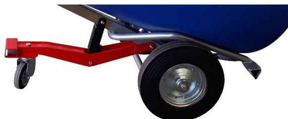
Béquille avec amortisseur