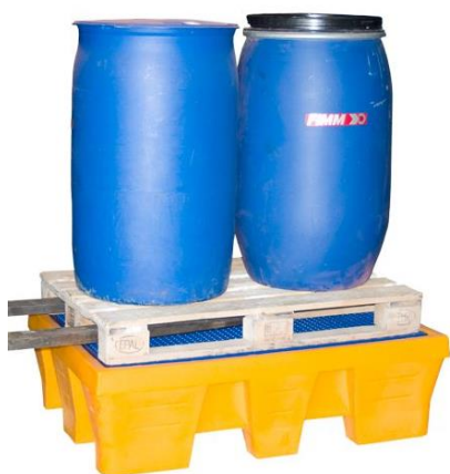
845 006 629 2 fûts