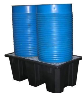
Bac en PE recyclé capacité 220 L