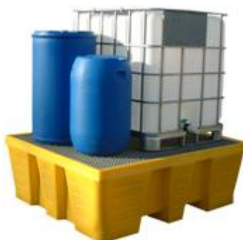
Bac avec caillebotis acier galvanisé capacité 1000 L