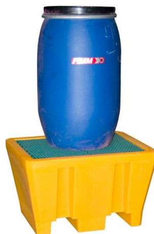
845 006 625 1 fût