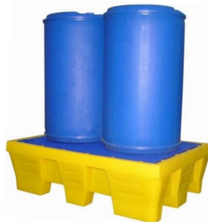
845 006 623 2 fûts