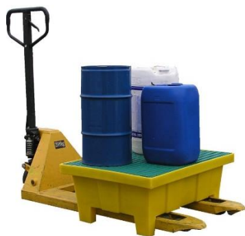
Bac avec pieds capacité 70 L