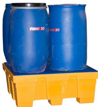
845 006 632 4 fûts