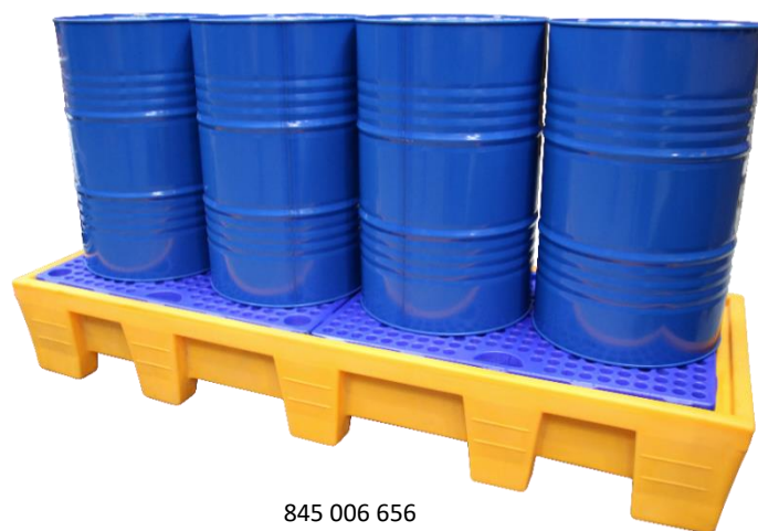
845 006 656 4 fûts