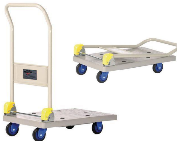
805 007 167 – Chariot 150kg sans frein