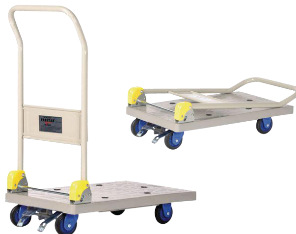
805 007 170 – Chariot 150kg avec frein