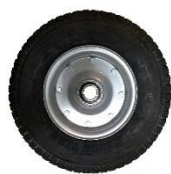
Ø 400 mm pour les remorques CU 2T et 3T 872 000 419 – pour remorques CU 2T 872 000 427 – pour remorques CU 3T et plateaux 2000 x 1000 ou 2520 x 1250 mm

Ces jantes permettent le changement aisé du bandage.