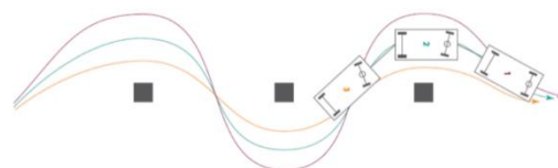
Possibilité de mise en train