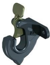
872 000 412 Pour remorques CU 2T et 3T

Pas de possibilité d'inversion du sens de traction.