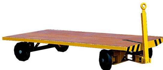
Sur fusées articulées - 1 essieux directeurs