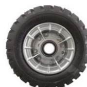
Ø 450 mm pour les remorques CU 5T 872 000 159 – pour remorques CU 5T 872 000 435 – pour remorques CU 5T et plateaux 3000 x 1500 ou 4000 x 1800 mm