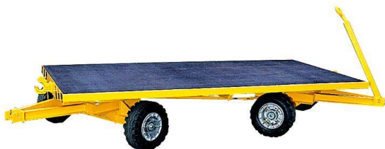
Sur couronnes à billes - 2 essieu directeur