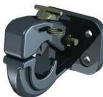
872 000 428 Pour remorques CU 5T

2 crochets d'attelage avant et arrière pour inversion du sens de la marche.