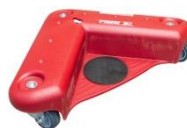
Coins roulants plastique