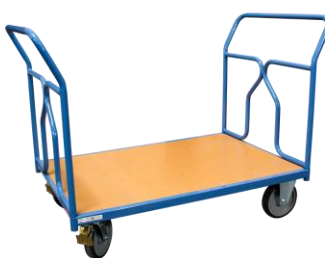
2 dossiers + 1 ridelle