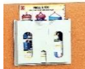
802 000 001 Porte document plastique autocollant