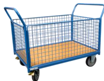
2 dossiers + 2 ridelles